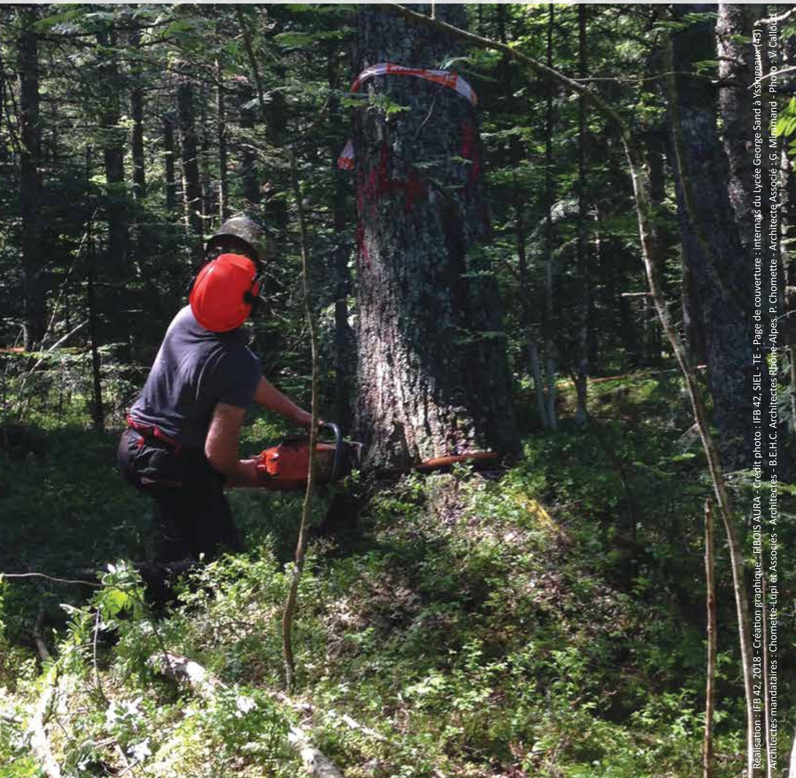
Réalisation : IFB 42, 2018 - Création graphique : FIBOIS AURA - Crédit photo : IFB 42, SIEL - TE - Page de couverture : internes du Lycée George Sand à Yssingeaux (43) ; Architectes mandataires : Chomette-Lupi et Associés - Architectes - B.E.H.C. Architectes Rhône-Alpes, P. Chomette - Architecte Associé ; G. Miramand - Photo ; V. Calloud