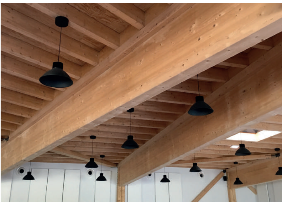
Espace rural d'animation à Saint-Symphorien-de-Lay - Architecte : Fabriques Architectures Paysages

Une cinquantaine de participants ont pris la route de Bordeaux pour découvrir tout au long du voyage : un parc éolien, un parc photovoltaïque, une centrale biomasse, et bien sûr, des constructions en bois.